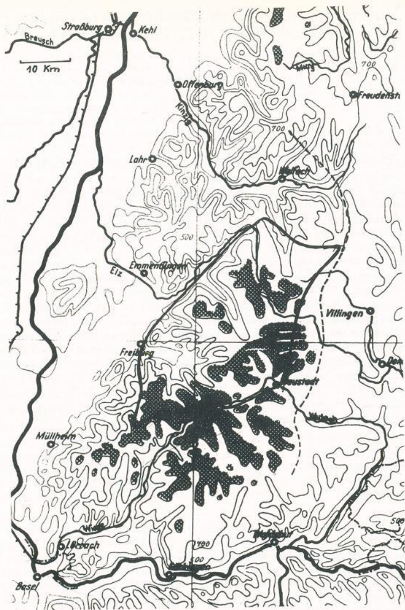
Abb. 1: Ungefähre Grenzen des Areal der Grün-Erle im Schwarzwald (—) und zwischen Grundgebirge (W) und Buntsandstein (O) (----). Raster: Gebiete über 1000 m Meereshöhe; Kartengrundlage: Klima-Atlas von Baden-Württemberg.

gesichts dessen guter Durchmusterung unwahrscheinlich. Sonst fügen sich die alten Berichte gut in das heutige Bild ein. Das östlichste Vorkommen, im Bernecktal südlich Schramberg (Dr. BOGENRIEDER mündlich), liegt etwas außerhalb der Karte. Die Grün-Erle erfüllt ihr Areal weithin so dicht, daß mit Sicherheit nicht jedes Vorkommen erfasst und kartiert worden ist. Auch mögen weitere Beobachtungen die Grenzen um ein geringes verschieben. Für die Deutung des Areal ist jedoch die Tatsache weit wichtiger, daß Ahnus viridis aus anderen