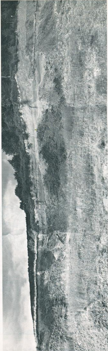
Abb. 2: Sandgrube etwa 50 m östlich von Moor (B). Man erkennt die fast horizontale Lagerung der feinkörnigen, liegenden Schichten. Die Westwand (links im Bild) ist dem Moor am nächsten.