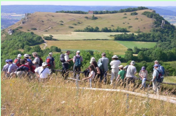
Tagung 2005 Erlangen