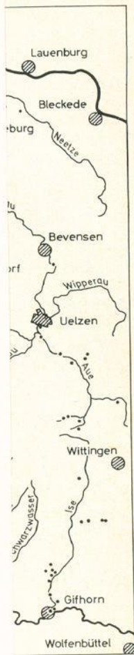
rg und Umgebung

Seite 33, Abb. 1: Die Verbreitung von Myrica gale ist im NW-Teil des von der Karte erfaßten Gebietes nicht untersucht und kartiert worden.