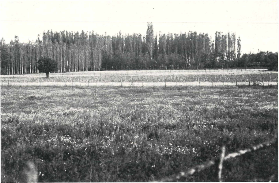
Abb. 3: Alopecuro-Ranunculetum marginati im (gelben) Blühaspekt von Ranunculus marginatus (helle Flächen im Mittelgrund). Wechsellasse Saisonwiese im Überschwemmungsbereich des Piniós, von Juni bis Oktober mit Zea mays bepflanzt, anschließend als Brachweide genutzt. Piniós-Delta bei Omólion, 20 m ü.N.N., 28.5.1974.