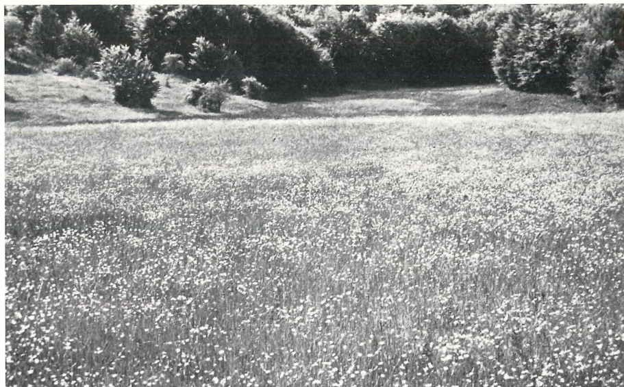
Abb. 2: Cynosuro-Caricetum hirtae im (gelben) Blühaspekt von Ranunculus velutinus . Grundwasserbeeinflusste, einschürige Wiese mit Schmelzwasser-Überstauung im Frühjahr, in der zweiten Jahreshälfte unregelmäßig beweidet. Im Hintergrund Rodungsgrenze des montanen (extrazonalen) Fagus moesiaca -Waldes. Die Einzelbüsche (oben links) sind in ihrem unteren Teil durch Viehverbiß verformt. Ossa-Gebirge, 800 m ü.NN., 27.5.1974.