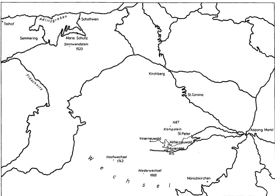
Abb. 1: Lage der Untersuchungsgebiete

Ein gewisser kontinentaler Einschlag des Klimas spiegelt sich auch in den Temperaturverhältnissen wider. So liegen die mittleren Jahresschwankungen der Temperaturen beträchtlich über den Werten vergleichbarer Höhenlagen in den herzynischen Mittelgebirgen des Harzes, Thüringer Waldes und Erzgebirges.