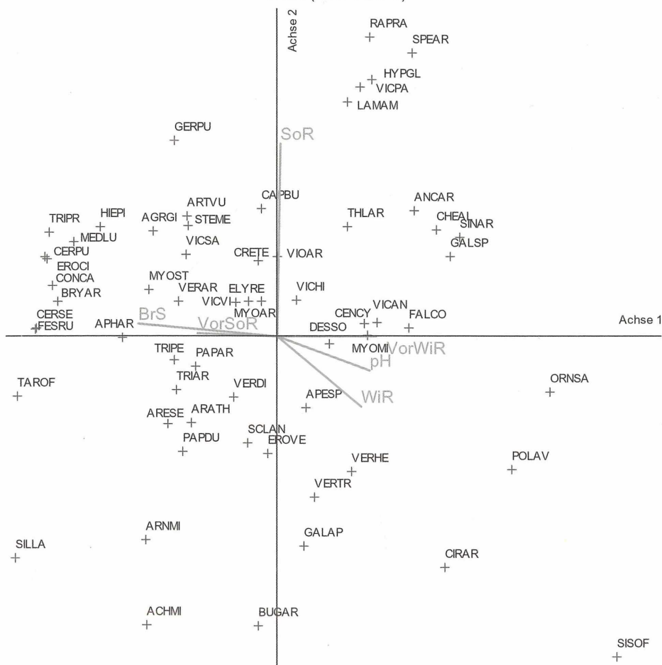
Abb. 2: DCA-Biplot der Artenzusammensetzung der Vegetationsaufnahmen und Standort- sowie Bewirtschaftungsparameter auf der Untersuchungsfläche