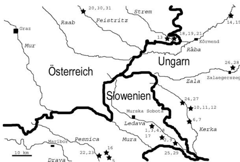
Abb. 1. Karte des Untersuchungsgebietes mit Staatsgrenzen (dicke Linie), wichtigen Städten (schwarze Rechtecke) und Flüssen (dünne Linien, Flussnamen kursiv); die Sterne zeigen die Untersuchungslokalitäten (daneben die Aufnahmeummern).

Die untersuchten Standorte unterliegen z. T. drastischen Veränderungen – und wie in anderen Bereichen Mitteleuropas sind die Auswirkungen vielschichtig und heute die Hauptgründe für den hohen Gefährdungsgrad der Art (HORSTHUIS et al. 1994, ILIJANIĆ et al. 1998). Ziel dieser Arbeit ist, neben den österreichischen Vorkommen möglichst naturnahe und unveränderte Standorte der Schachblume in den Nachbarländern Ungarn und Slowenien pflanzensoziologisch zu untersuchen und so Einblick in die ursprüngliche ökologische Einnischung im mitteleuropäischen Arealteil zu gewinnen. Auf dieser Basis sollen Maßnahmen zur Erhaltung und Förderung der Art auf Sekundärstandorten erarbeitet werden.