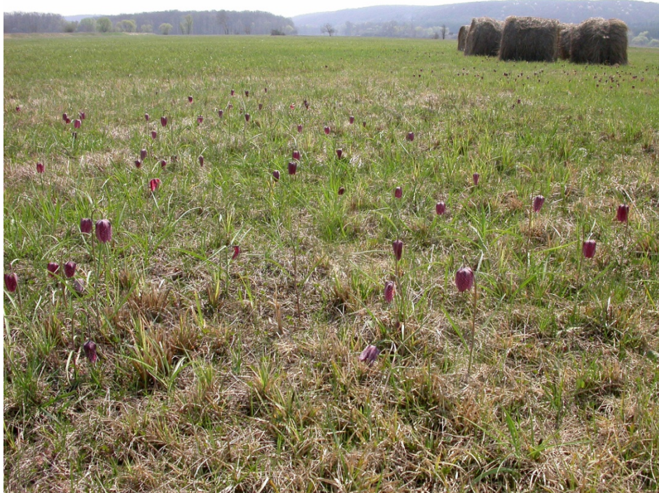
Abb. 3. Reichblühende Fritillaria meleagris in einem Festuco pratensis-Alopecuretum pratensis bei Luisling (Österreich, Burgenland), (, 15.04.2005).