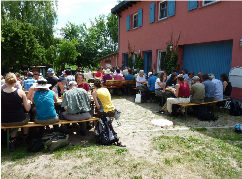
Abb. 4. Gemeinsames Mittagessen an der Havel während der Potsdam-Tagung 2011.

Seit 1950 gab es über die meisten Tagungen in den Mitteilungen/Tuexenia hinterher Berichte unterschiedlicher Ausführlichkeit (s. Tabelle 1). Diese Tradition endete mit dem Bericht über Freiburg 1990 (WILMANN et al. 1991). Inzwischen waren nämlich die vorher erstellten Tagungsführer so breit und ausführlich angelegt, dass eine zusätzliche Berichterstattung hinterher nicht mehr notwendig erschien. Dies gilt noch mehr seit Greifswald 2008 mit der neuen Publikationsreihe der Tuexenia-Beihefte als Tagungsführer. Die umfangreichen Bände werden an die Tagungsteilnehmer verteilt und sind für alle Mitglieder erwerbbar, seit 2021 auch als pdf-Datei auf der Homepage verfügbar. Schon zuvor war zur Jubiläumstagung in Göttingen 2002 (90 Jahre FlorSoz) der Tagungsführer in den normalen Band von Tuexenia 22 integriert.