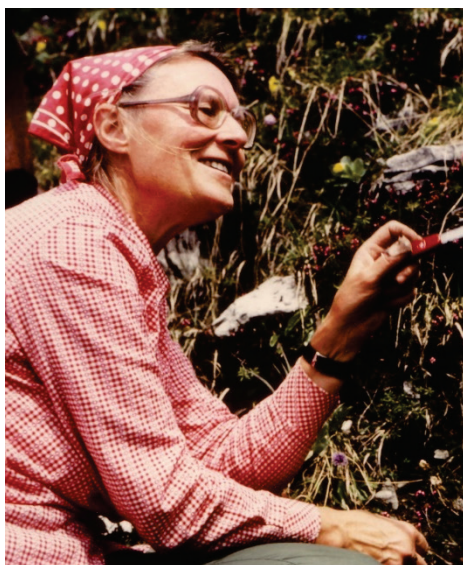
Bei der Alpenexkursion 1980.