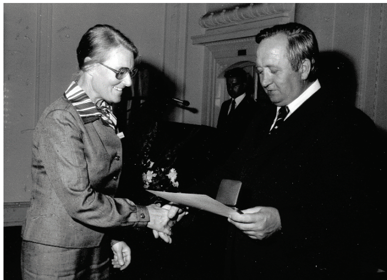
Verleihung der Silbernen Staatsmedaille für Naturschutz durch Minister G. Weiser 1978.